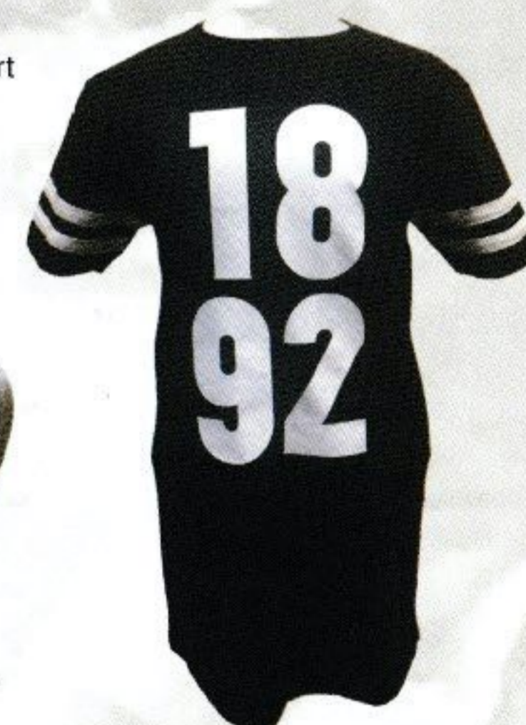
T-SHIRT 1892 LANG

NU VERKRIJGBAAR IN MIJNVITESSE (GELREDOME) EN VIA VITESSE.NL/WEBSHOP