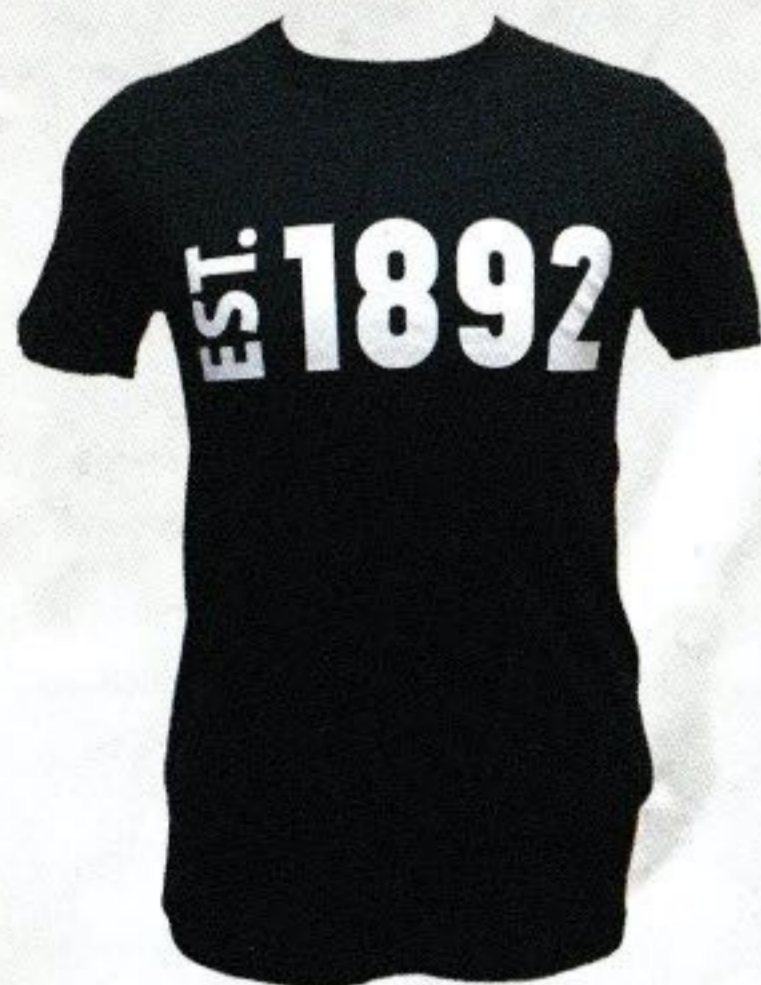
T-SHIRT EST. 1892 blauw