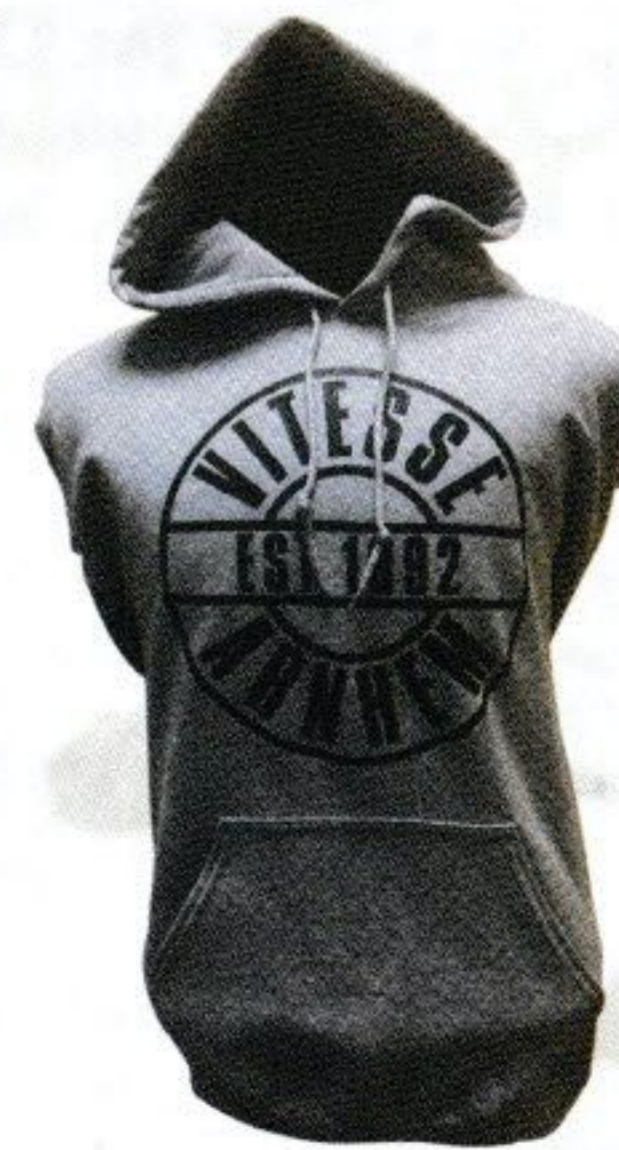
HOODIE VITESSE ARNHEM