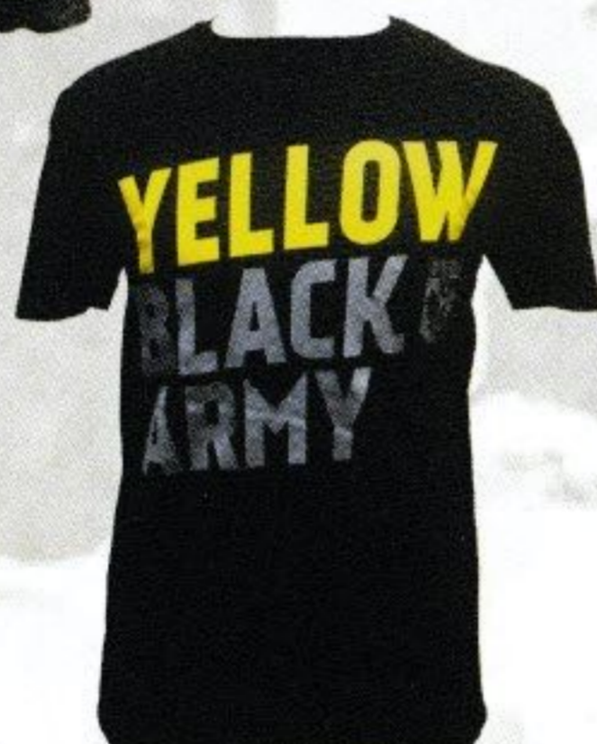
T-SHIRT YELLOW BLACK ARMY