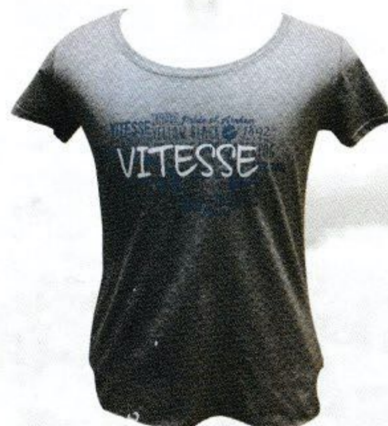
T-SHIRT DAMES grijs