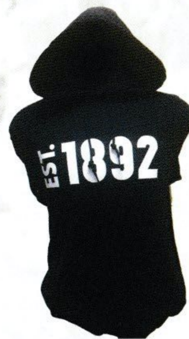
HOODIE EST. 1892