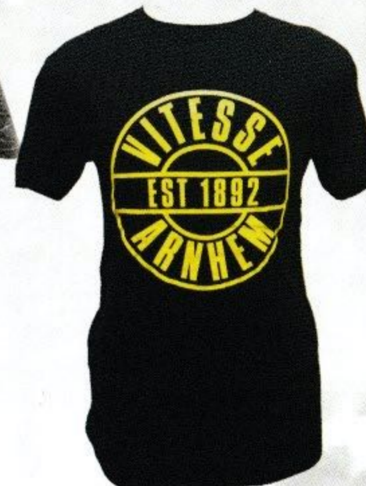
T-SHIRT VITESSE ARNHEM zwart