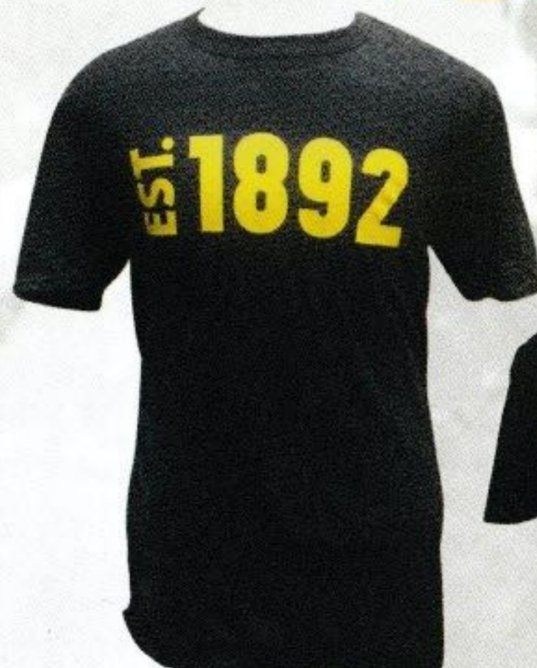
T-SHIRT EST. 1892