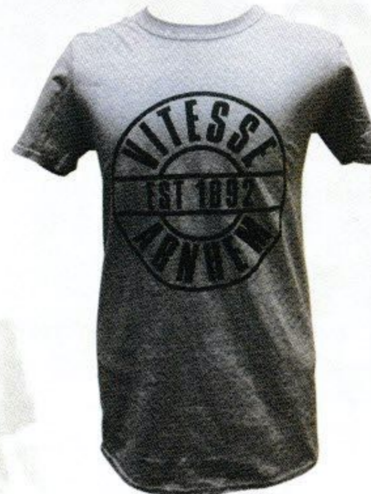
T-SHIRT VITESSE ARNHEM grijs