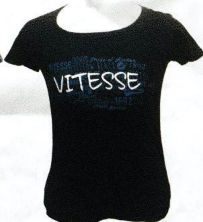
T-SHIRT DAMES blauw